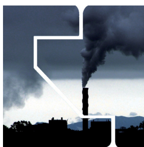
ODPORNNA NA VPLIV AGRESIVNIH KEMIKALIJ