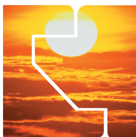
IZJEMNO UV ODPORNA